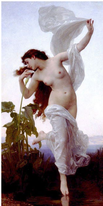
«Αυγή» του ρομαντικού καλλιτέχνη William-Adolphe Bouguereau . Πηγή: Public Domain

Με το ρωμαϊκό αντίστοιχο, την Αυγή, αντιπροσώπευε τη δόξα της νέας ημέρας.