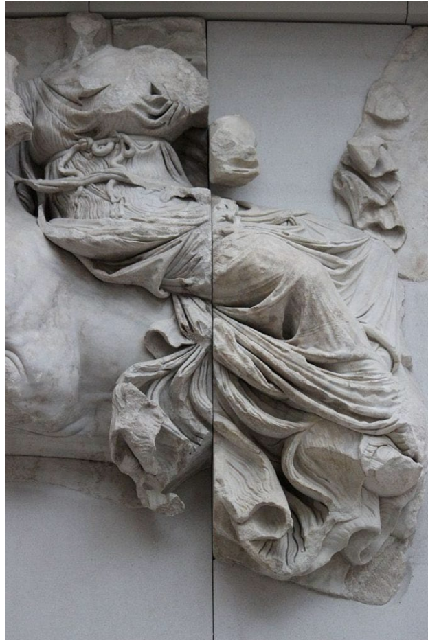
Η Ηώς, απεικονιζόμενη στη ζωφόρο της Γιγαντομαχίας , ιππεύοντας άλογο στο Βωμό της Περγάμου, Μουσείο Περγάμου, Βερολίνο, Γερμανία.

Η Ηώς ήταν κόρη των Τιτάνων Υπερίωνα και Θείας . Ο Υπερίωνας ήταν γνωστός ως ο φορέας του φωτός, Αυτός που Κατοικεί Ψηλά Πάνω από τη Γη. Η Θεία ονομαζόταν Θεία, όπως και η Ευρύθεια , «λαμπερή σε όλους» και η Αίθρα , «φωτεινός ουρανός». Ο Ησίοδος, στη Θεογονία του, ισχυρίστηκε ότι η Ηώ ήταν αδελφή του Ήλιου, του θεού του ήλιου, και της Σελήνης, μιας από τις θεές της σελήνης, «που δίνουν φως σε όλους όσους βρίσκονται στη γη και στους αθάνατους θεούς που ζουν στον απέραντο ουρανό».