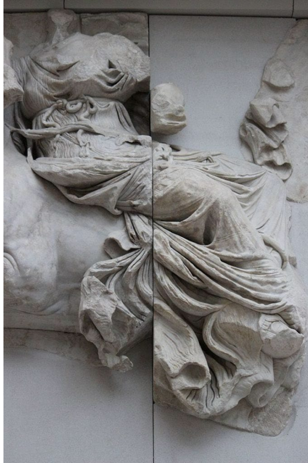
Эос, изображённая на фризе «Гигантомахия», верхом на коне на Пергамском алтаре, Пергамский музей, Берлин, Германия.

Эос была дочерью титанов Гипериона и Тейи. Гиперион был известен как носитель света, Тот, Кто Пребывает Высоко Над Землёй. Тейю называли Божественной, а также Эврифеей, «широко сияющей», и Эфрой, «ярким небом». Гесиод в своём произведении «Теогония» утверждал, что Эос была сестрой Гелиоса, бога солнца, и Селены, одной из богинь луны, «которые светят всем, кто на земле, и бессмертным богам, живущим на бескрайнем небе».